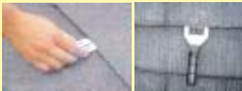
①下塗り後、 タスペーサーを挿入

※タスペーサーは、屋根材(910mm幅)1枚につき左右両方に挿入。1㎡に8~10ヶ使用します。<W工法の場合>