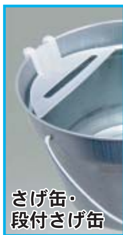
さげ缶・ 段付さげ缶