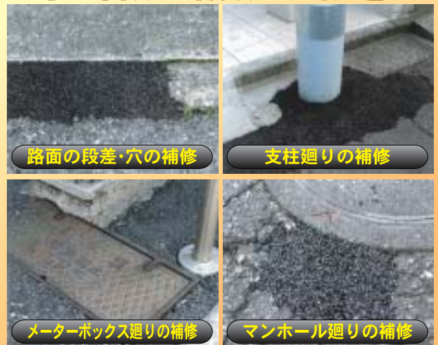
路面の段差・穴の補修