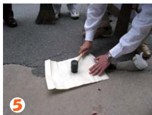
5 ハンマー等で填圧すると更に硬さが増します。