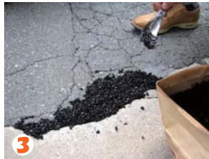
3 2~3 cm程かさ上げて均一に広げます。