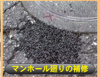
マンホール廻りの補修

5 kg : 縦50 cm × 横50 cm 深さ1cm程度分 ¥3,780 (税込)