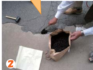
2 袋から材料をそのまま投入します。