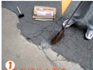
1 大きな塊や小石を取り除きます。