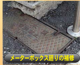
メーターボックス廻りの補修