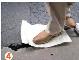
4 付属の離型紙、又は新聞紙等を敷いて踏みます。