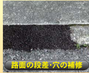
路面の段差・穴の補修